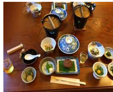
民宿尾瀬野の食事